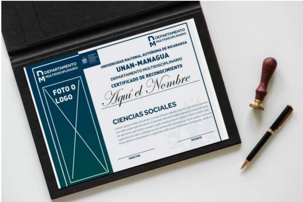
Certificado del Departamento Multidisciplinario