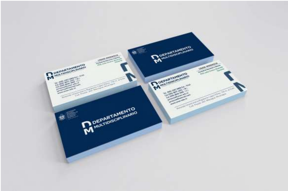
Tarjetas de presentación del Departamento Multidisciplinario