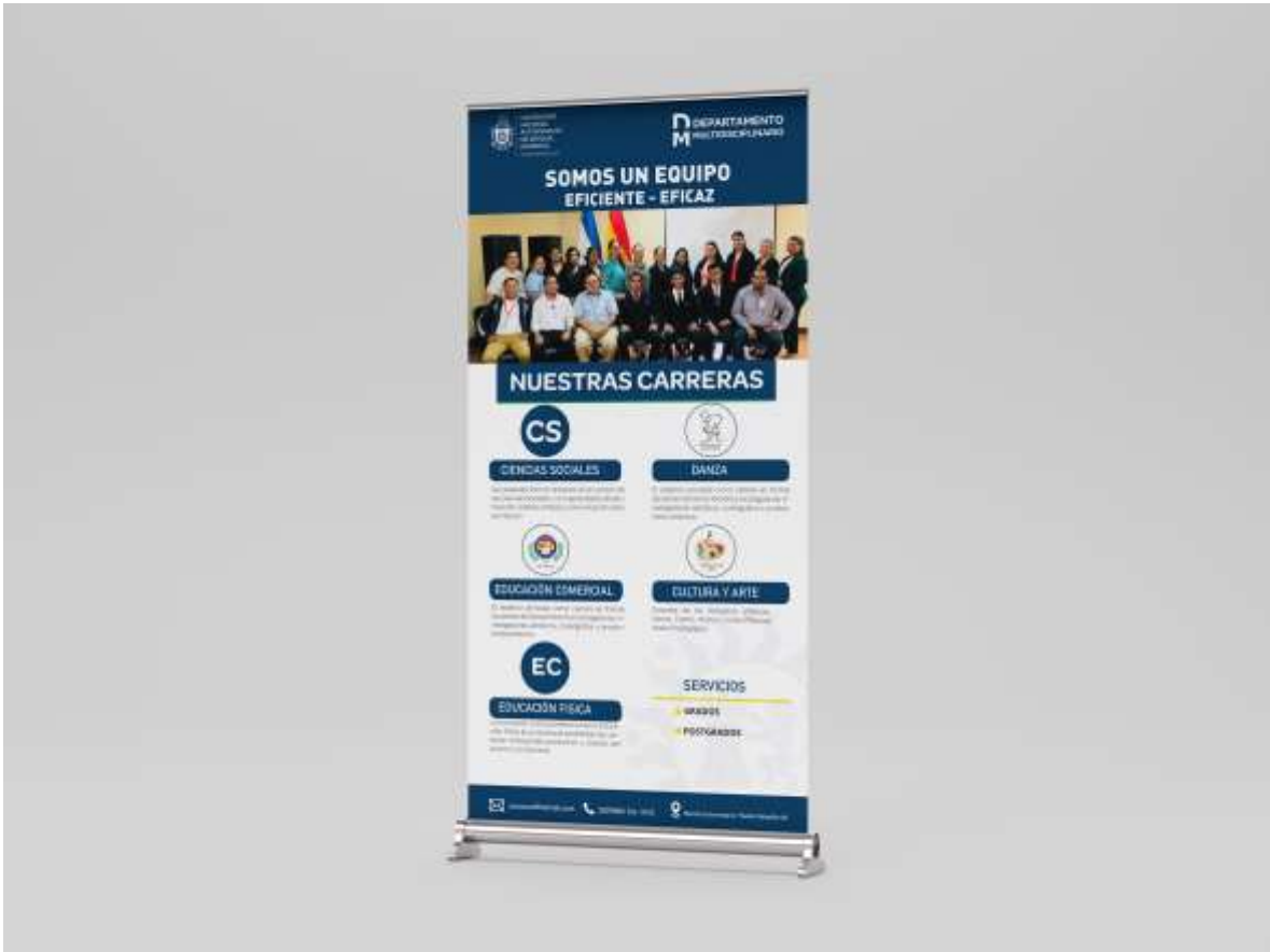
Banner Departamento Multidisciplinario