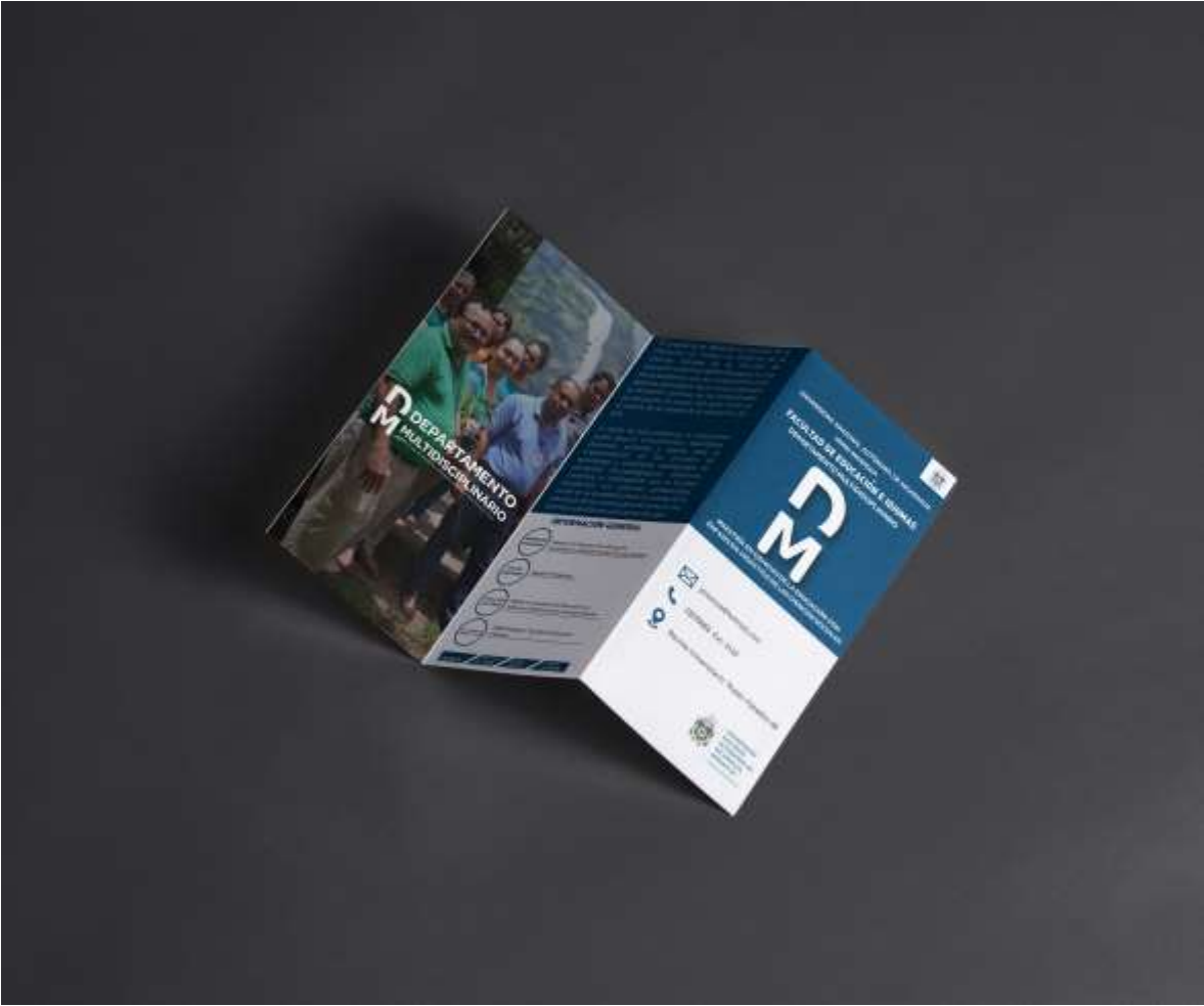
Brochure maestrías del Departamento Multidisciplinario