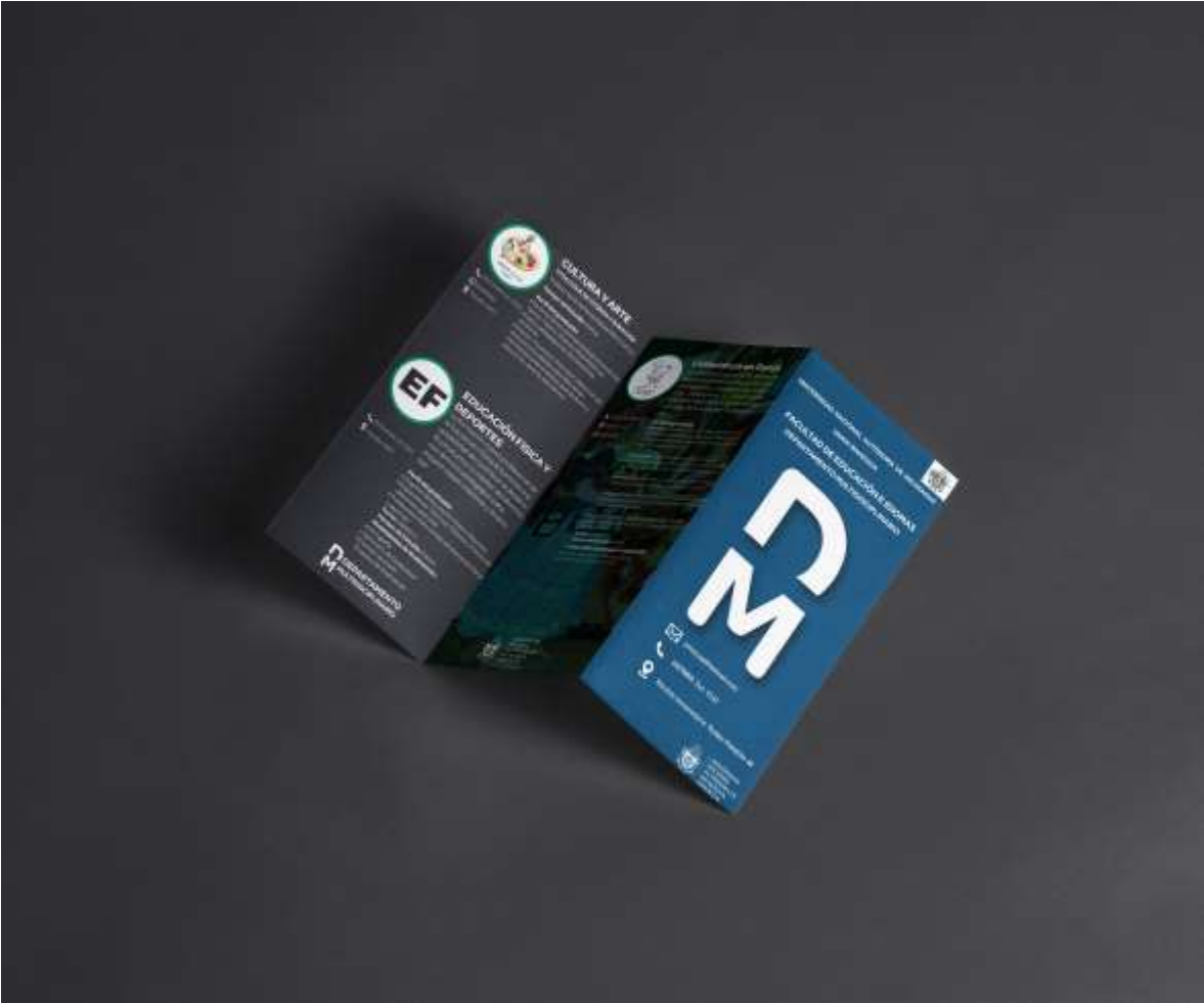
Brochure del Departamento Multidisciplinario