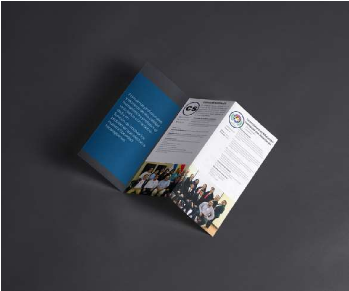
Brochure del Departamento Multidisciplinario